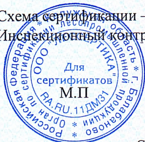
Схема сертификации – 1с(м). Инспекционный контроль – июнь 2022 года, июнь 2023 года.